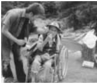
お気に入りのボウシで