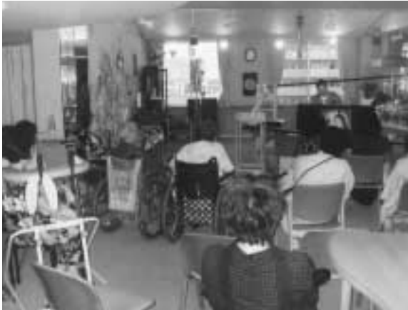
紙芝居のはじまりはじまり