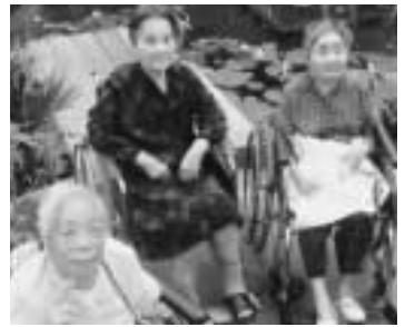
ハスの花の前で3美女